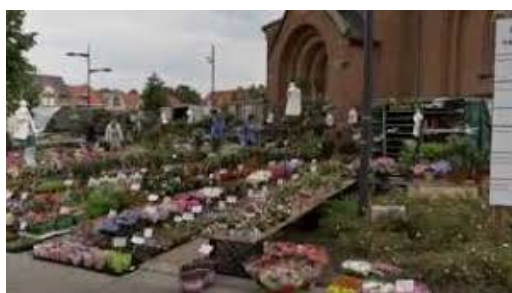
Markt in Paal

De Morgenstonders die hun wandeling beperkten tot een vijftal kilometers waren na hun tocht terug te vinden op het gemeenteplein waar de wekelijkse markt doorging.